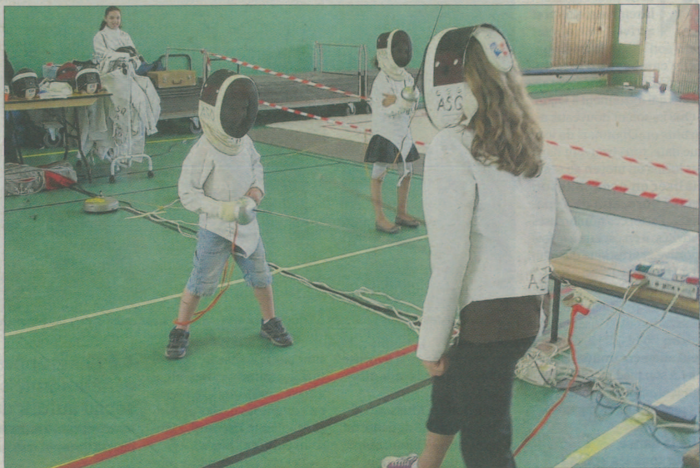
L'escrime peut être pratiquée chez les enfants, adolescents et adultes.